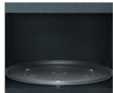
Intérieur en céramique émaillée