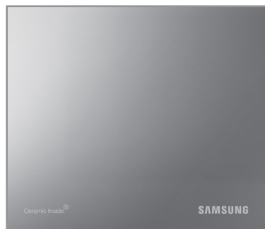
Design au fini miroir