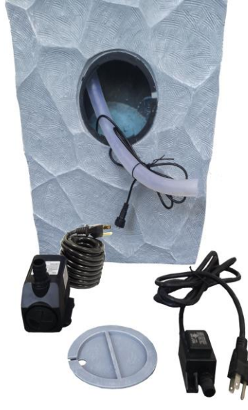
Locate the tubing and light connection from inside the fountain.