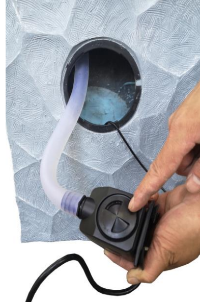
Attach the tubing to the pump. Water flow can be adjusted using the control on the front of the pump. Place the pump inside the fountain.