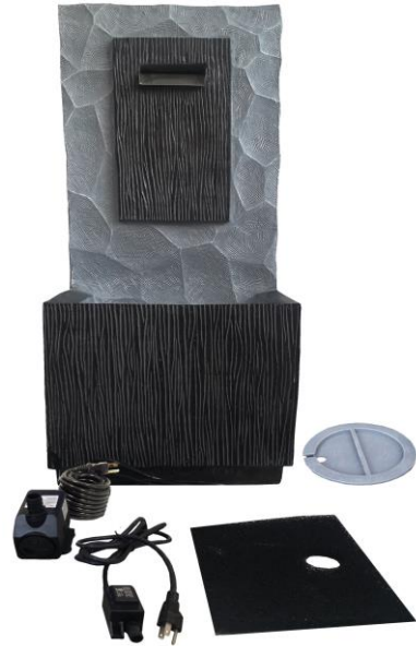
Carefully unpack and arrange all parts.

We hope you will find these instructions helpful in setting up your product. If you have any issues with this item, DO NOT return the unit to place of purchase. Please visit our web site www.angelodecor.com for assistance and warranty information.