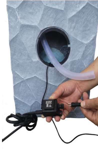
Securely attach the cable from the light to the transformer. The transformer should not be submerged.