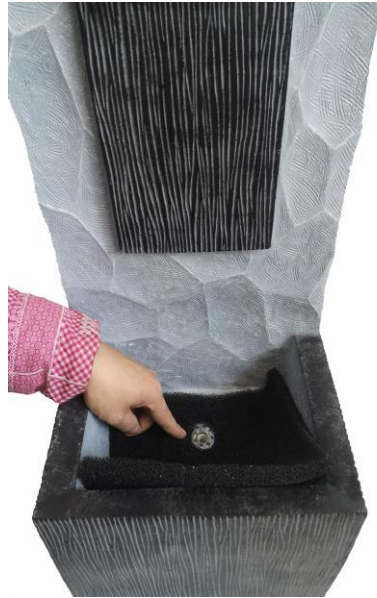
If desired, the optional black foam can be installed in the reservoir (as shown above) to help reduce splashing during operation.

Align the pump and light cords with the notch, then install the pump access door.